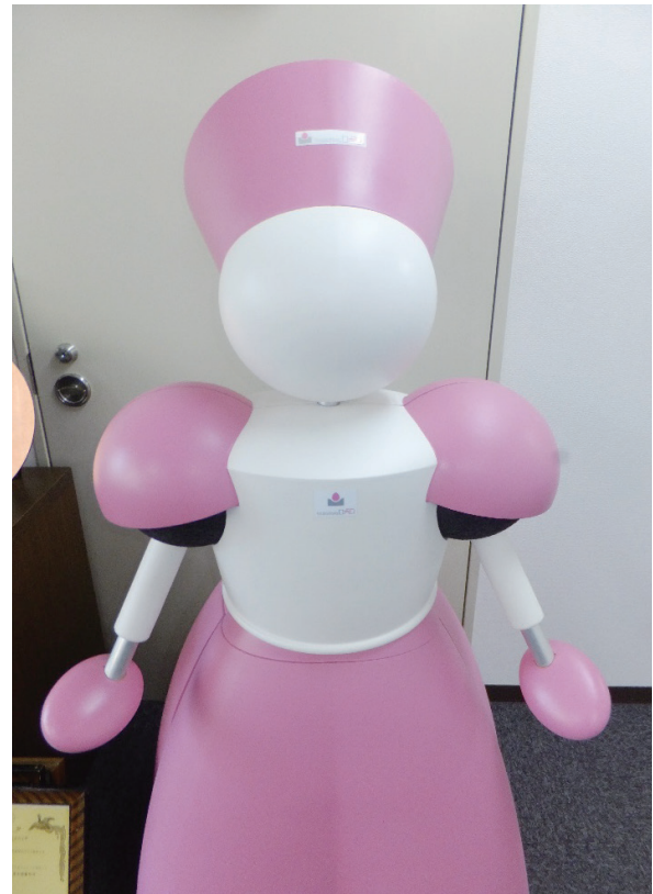
接触検出ソフトカバーを全身に装着したロボット(モデル)

接触検出ソフトカバーを多くの現場に展開していく同社の取組みから、今後も目が離せない。