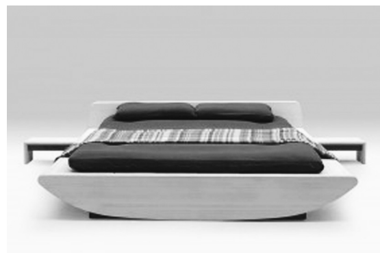
デザイナーのデザインによる羊毛桐材ベッド