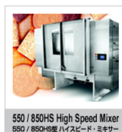
550 / 850HS High Speed Mixer 650 / 850HS型 ハイスピード・ミキサー