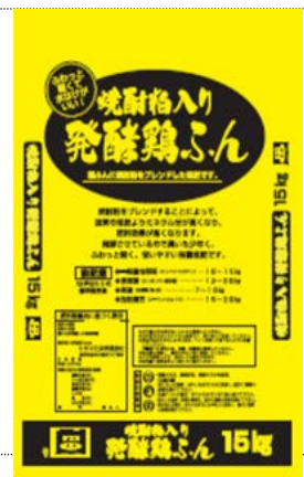
焼酎粕入り発酵鶏ふん