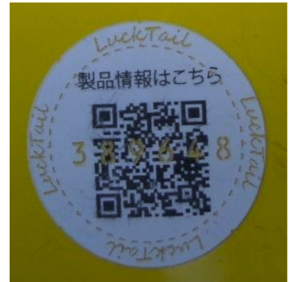
QRセキュリティラベル