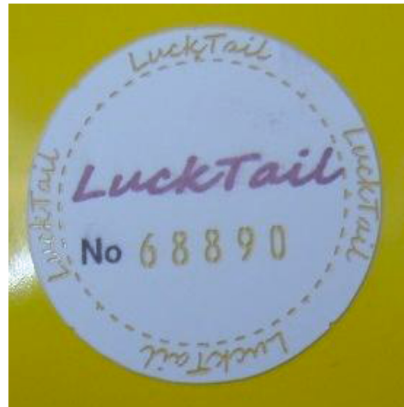
LTセキュリティラベル