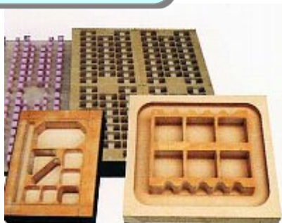
木型(上)とエコスターチ製品(右)