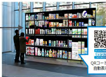
QRコードも自動表示