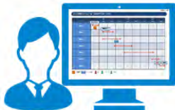
(1)クラウドで商品棚コントロール