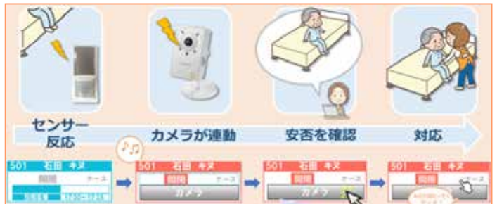
図. 「Poraネット」の活用イメージ