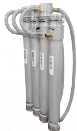
内照式小型据置きタイプ