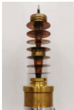
ハイブリッド冷却システム