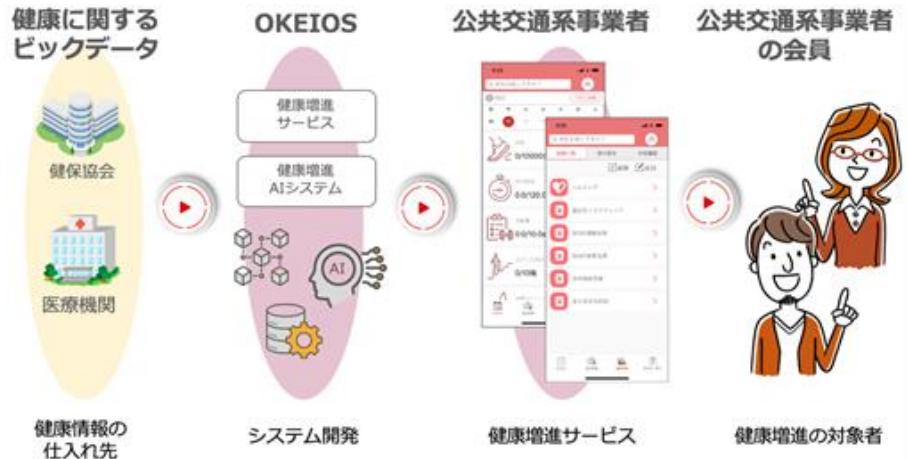
右図:健康増進システムの提供イメージ