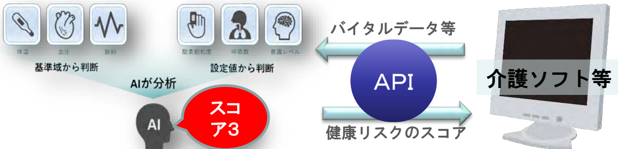
提供するサービスのイメージ