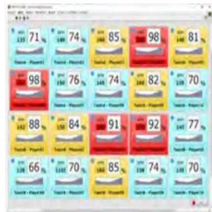
多人数心拍計測とコミュニケーションサービスの融合事例(サッカー)