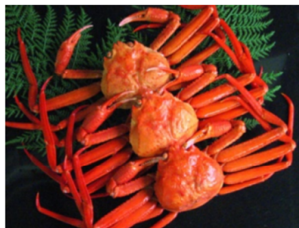
キトサンは甲殻類の殻から得られる安全な天然素材