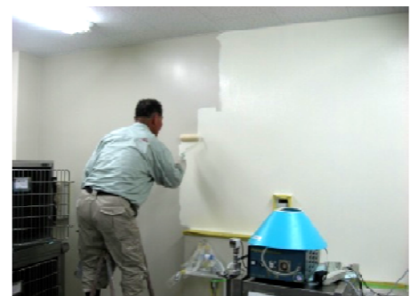
ローラーや刷毛で内壁にも簡単に塗布できる