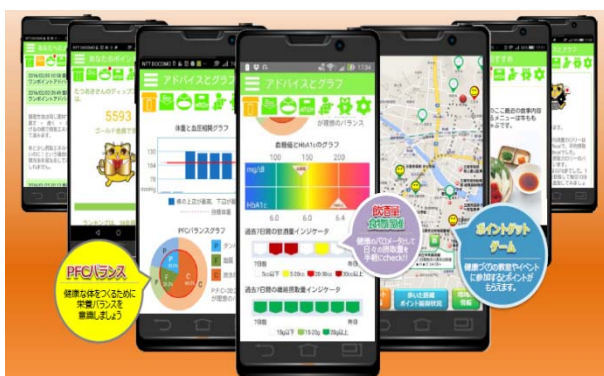
■糖尿病予防支援アプリイメージ