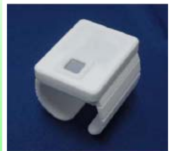
■ゆとりバランス測定器