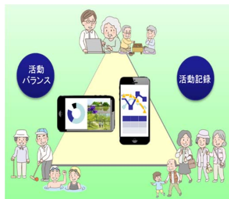
■認知症予防の概念