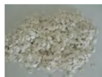
広島産牡蠣の殻から製造した焼成品