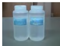
超高濃度カルシウムイオン水