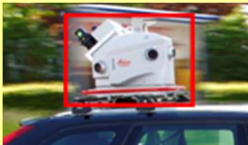
移動計測装置(ペガサス)