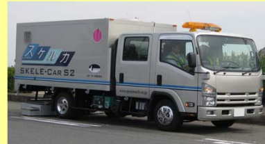
高速・高解像度地中レーダ装置(スケルカ)