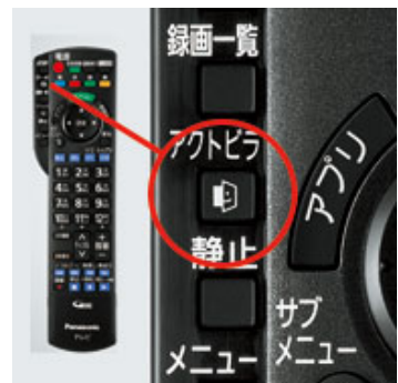
【アクトビラボタン】