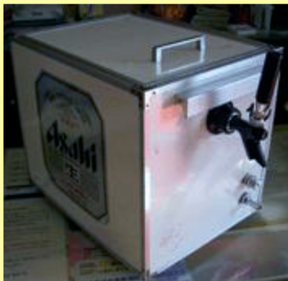
従来型ビールサーバー