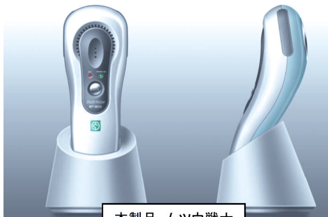
本製品: ムツウ戦士