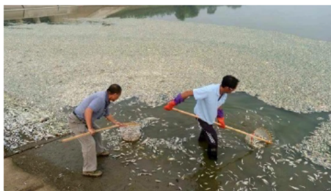
死滅した魚(ベトナム国 Ha Tinh省)