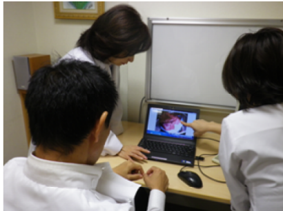
指導マニュアルビデオの視聴風景