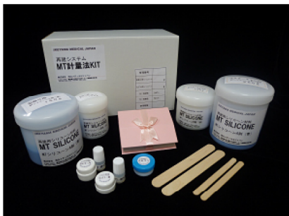
再建システムキット