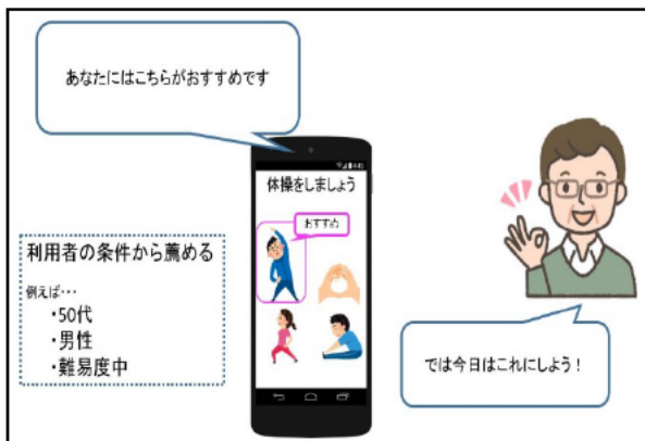
アプリのイメージ