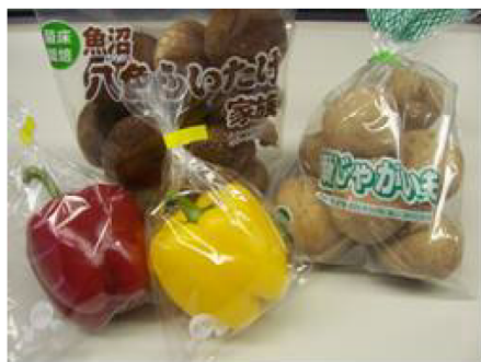
【青果物を包装したパッケージフィルム】