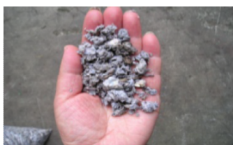
溶解処理後 (生成された再生パルプ原料)