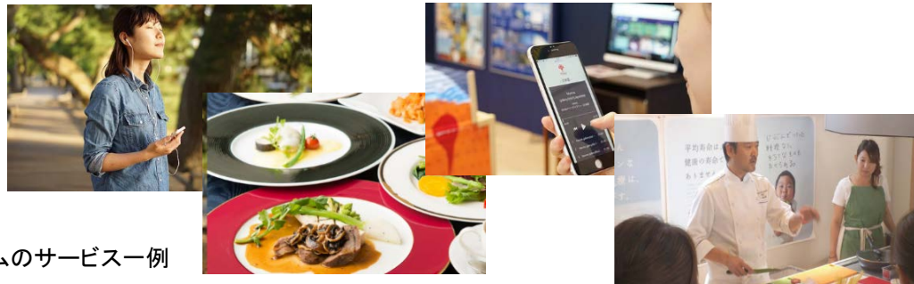
スマートヘルスツーリズムのサービス例