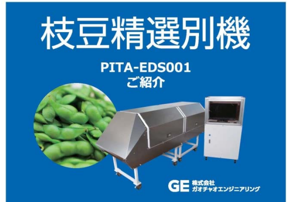
高性能枝豆精選別機