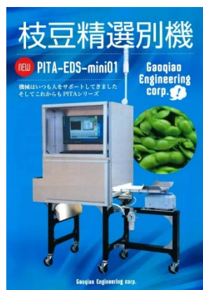
枝豆精選別機汎用型