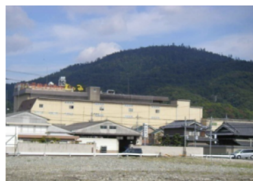
三輪山麓 巽製粉(株)工場

「地域ブランド」をテーマに米消費拡大を模索していた「JAならけん」と米粉を利用した新商品を模索していた地元企業「巽製粉(株)」が連携して、奈良県産加工用米の米粉を用いた「米粉入り手延べ素麺等の加工食品」「米粉入り冷蔵パン生地等の食品材料」の開発・製造に取り組み、安心安全な自県産原料を活用した商品開発を行う。二社の連携により、奈良県の新たな地域ブランドの定着を目指す。