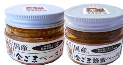
金ごまペースト商品

農事組合法人国産金ごま生産組合は、鶏ふんをすきこんだ土壌づくりや種からの生産履歴栽培によるトレーサビリティの確保、栽培面積の増加による安定生産を図る。福祿商店は、金ごまペーストのレシピ開発を行うとともに、百貨店や専門スーパー、自然食品販売店等への販売網を活用することで、健康や安全意識の高い本物志向の消費者層への販売促進・PRを行う。本連携事業を契機に、食品としての新たな金ごま市場の新規開拓を目指す。