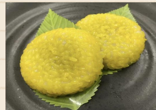
輪島名物えがらまんじゅう