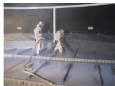
新分野例（ポリウレアコート施工例）