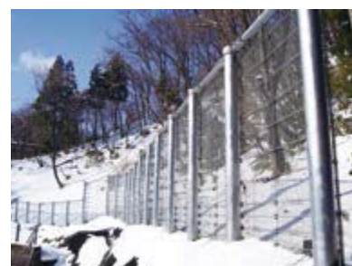
新分野例（防護柵施工例）