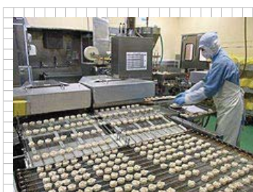
シュウマイ製造ライン

企業名 株式会社ホソヤ コーポレーション 業種 惣菜製造業 所在地 千葉県佐倉市太田2056 資本金 95百万円 設立 昭和27年2月 売上高 4,533百万円 (平成25年9月期) 従業員 366人 (正社員69人)