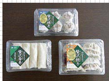
贅沢シリーズ3品 (贅沢春巻、贅沢焼売、贅沢餃子)

フルオートメーションに近い生産形態を取っている大手食品会社の支援における社内生産工場の原価低減活動では、効果が思うように得られなかった。今回は、省エネに対する意義と必要性を理解し、化学プラントで培われた手法を用いた省エネ活動を行うとともに、自動車生産工場での改善の視点を用いて、自社の生産管理・生産方式の見直しによる工程改善を行った。当社プロジェクトメンバーの意欲的な取組みもあり、支援期間中にコスト削減が実現するなどの大きな成果を上げることができた。