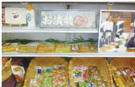
株式会社上沖産業の主力商品群

成7年に自ら漬物製造業に参入し、以後地元農業生産者と共に、『農業を通して地域の活性化に貢献し、農業と共に発展を目指す』をモットーに、生産日本一であるこの地域のラッキョウを中心とした地元農産物だけを用いて加工商品化する漬物製造業者としての活動を始めている。平成13年には自社で最終パッケージまで行う(左図の全行程を行う)体制を整え、生協や首都圏の百貨店・スーパーなどの現在の主要取引先へ納入を開始しており、現在ではラッキョウ漬けで日本一の生産量を誇るほか、大根、ごぼう、きんかん等を用いた80アイテムを数える漬物を生産販売するに至っている。