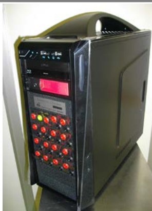
50kW未満低圧連系用パワコンチェッカー

井上喜株式会社 (福岡県福岡市) ・自社営業ネットワークの活用 ・販路開拓・マーケティング