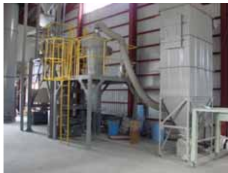
既存の分級装置(大分事業所)