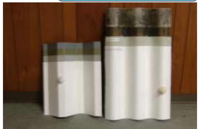
右図：ケミカルカチオンスレート