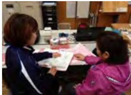
提供するサービスのイメージ