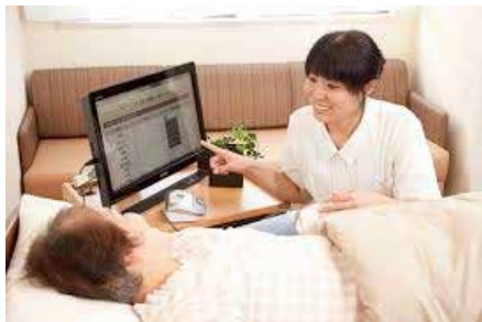
「安診ネット」の使用イメージ