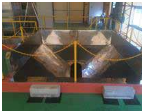
日量4.5tの受入ピット