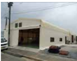
北九州エコタウン 地域循環圏リサイクルセンター