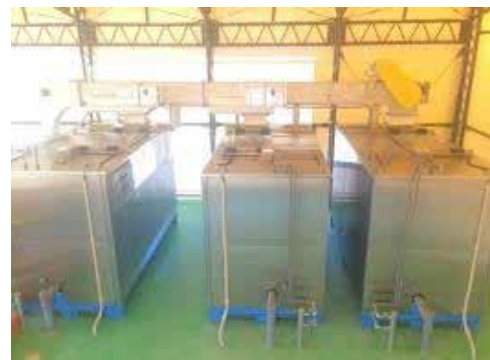
一次発酵装置1.5t/日(3台)