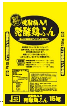
焼酎粕入り発酵鶏ふん