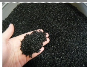
加硫合成樹脂ペレット