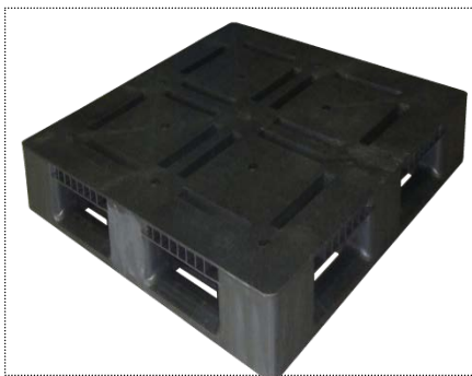
加硫合成樹脂パレット