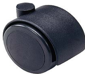
加硫合成樹脂キャスター