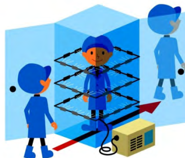
消毒設備イメージ