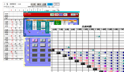
(センターシステム管理画面)