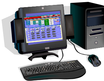
(遠隔通信センターパソコン)