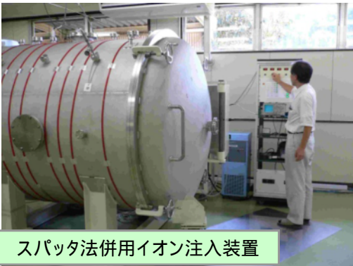
スパッタ法併用イオン注入装置