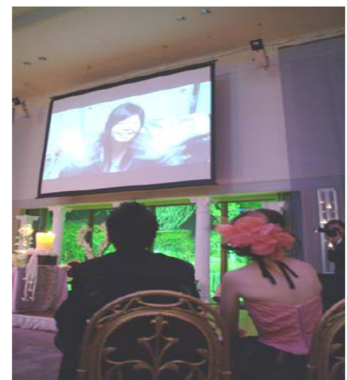
結婚式場での動画映像放映風景