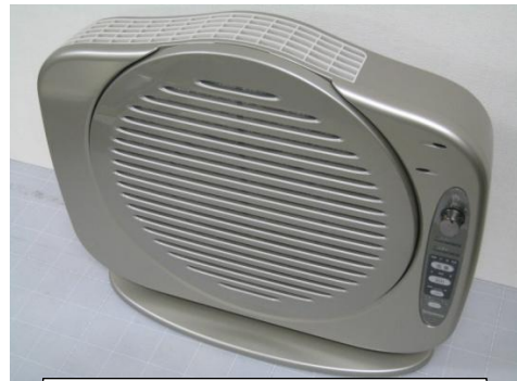
一体化ロータリーフィルターを活用した空気清浄機