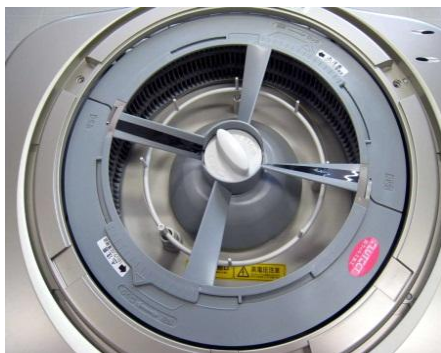
一体化ロータリーフィルター