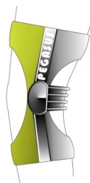
軽スポーツに使用できるサポーター状膝装具(イメージ)