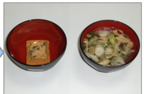
フリーズドライ味噌汁