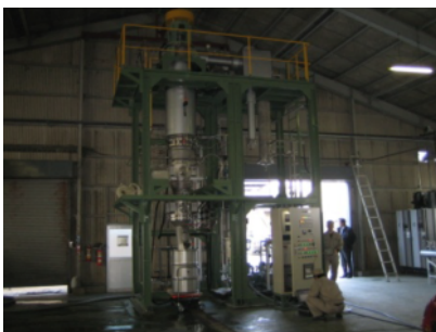
攪拌型薄膜蒸発器