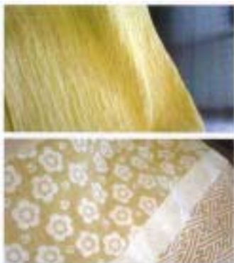
< ジャカード織の例 >