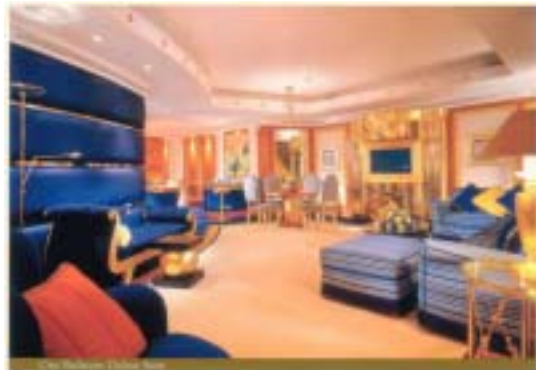
< 高級ホテルの例 >