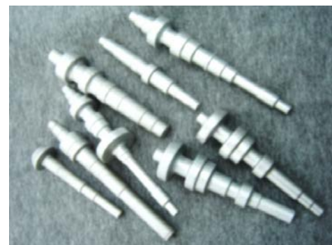
本事業が適用できる鍛造品(自動車用ギアシャフト)の例