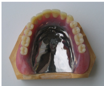
純チタン全部床義歯