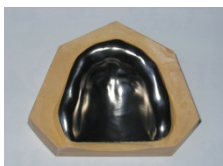
純チタンプレス成形全部床