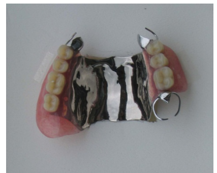
純チタン部分床義歯